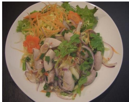
小袋のスパイシーサラダ