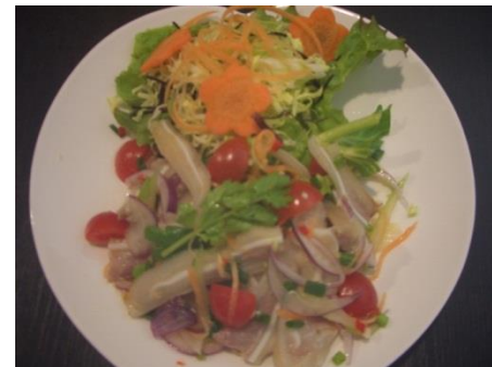
豚耳のスパイシーサラダ