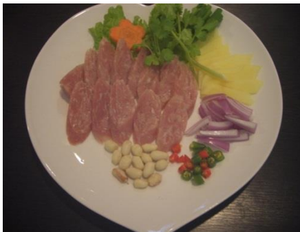
イサーン地方の生ソーセージ